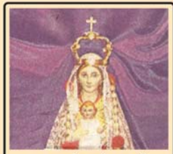
കോളർ ഖനിമാതാവ് അത്യാഹിതങ്ങളിൽ നിന്നു കാക്കുന്നു.