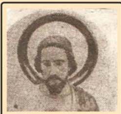
അസാധ്യ കാര്യങ്ങളുടെ മധ്യസ്ഥനായ യൂദാശ്ശീഹായേ, അങ്ങയുടെ സ്തുതികളെ ഞാൻ ലോകമെങ്ങും അറിയിക്കും.