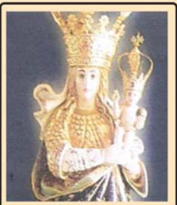
കൊട്ടിമുത്തിക്ക് പുവൻകുല നേർച്ച