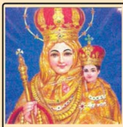
നിത്യസഹായി വേളാങ്കണ്ണി ആരോഗ്യമാതാവ്