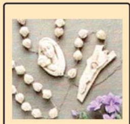
ജപമാല കൈയിലേന്തി 150 വട്ടം നന്മനിറഞ്ഞ മറിയാമിനെ വാഴ്ത്തി പ്രാർത്ഥിച്ചു.