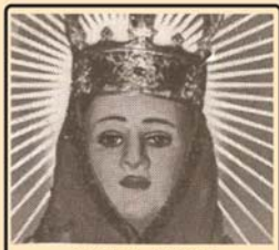
അനുഗ്രഹദായക പുല്ലിച്ചിറ അമ്മ