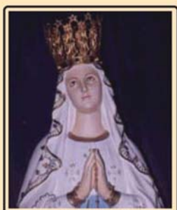
പുണ്ടിമാതാവ് 'അമ്മേ, അമ്മേ, കനിവുള്ളൊരമ്മേ!'